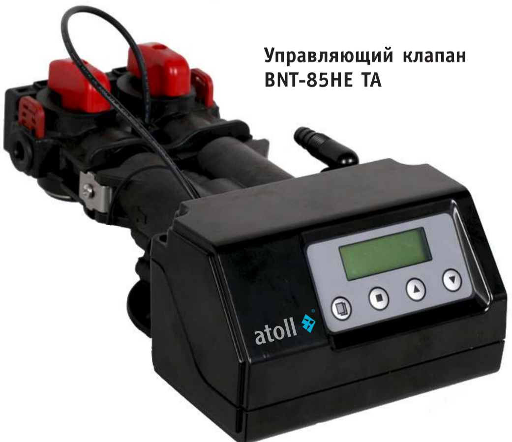
Управляющий клапан BNT-85HE TA